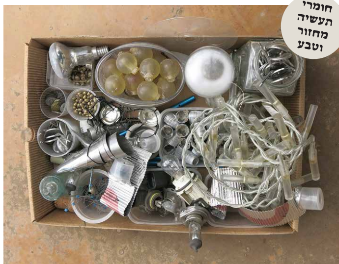
חומרי תעשייה מחזור וטבע