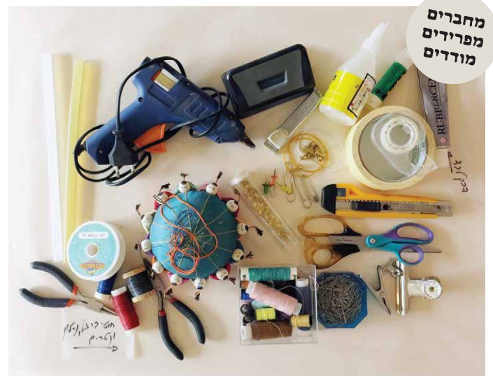
מחברים מפרידים מודדים